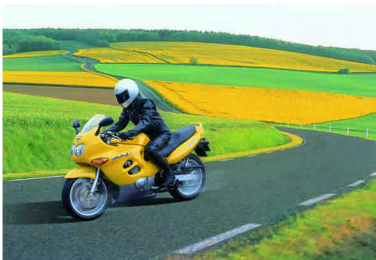
Figuur 4. Contrast met de omgeving; welke kleur van hesje nu te kiezen?