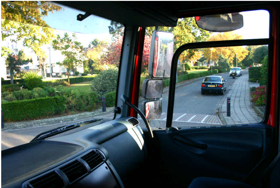
Figuur 2. Zoek hier de motor (hint : er zijn er twee).

verkeer belangrijk is. Laat ons voor deze discussie ons beperken tot dode hoeken in voertuigen. Dat zijn bijvoorbeeld de volgende zaken: A-spijlen (tussen voorruit en zijraam), B-spijlen (tussen de zijruiten voor en achter), binnenspiegel (al dan niet voorzien van 'leuke' dingen als dobbelstenen, BH'tjes, pluche voetballen en beestjes), steun voor het navigatiesysteem en telefoon aan de voorruit etc.. Allemaal objecten waar zich een motorrijder compleet achter kan verstoppen. Maar ook van overheidswege voorgeschreven veiligheidszaken zoals Dobli-spiegels en andere extra zijspiegels kunnen kijken, zien en waarnemen vaak ernstig belemmeren (zie figuur 2). Dit is het uitzicht vanuit een vrachtwagencabine op een zijstraat van rechts. In deze zijstraat bevinden zich twee motoren. De vraag is echter waar nu de tweede motor is in dit plaatje. 6