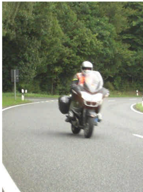
Figuur 3. Oranje fluorescerende kleding die wegvalt achter windscherm

Aan de grootte van de prikkel (het netvliesplaatje van de motorrijder) kan weinig gedaan worden. De signatuur van een motor blijft onder alle hoeken maar slechts eenderde van die van een gemiddelde middenklassenauto. Het doet zelfs de vraag rijzen of een verplichtstelling tot het dragen van fluorescerende kleding vanuit het opzicht van grootte enig effect heeft als maatregel. De prikkel die de opvallend geklede opzittende van een motor genereert, blijft namelijk ondergeschikt aan de grootte van de motor waarmee hij zich verplaatst. Vaak ook wordt in het frontale vlak het zicht op de kleding ontnomen door zaken als een windscherm (figuur 3). De schittering van het windscherm zelf in combinatie met het brandende dimlicht levert een behoorlijk hoeveelheid visuele prikkeling op en beperkt zelfs het nut van fluorescerende kleding.