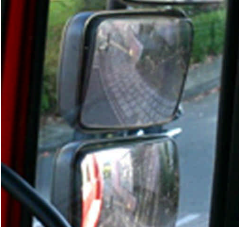
Figuur 1b. Wettelijk voorgeschreven zichtbevorderende middelen kunnen dus ook een zichtbeperking opleveren